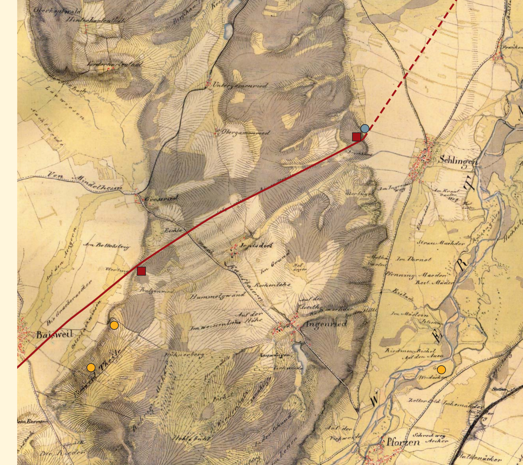
Römische Fundstellen südlich von Bad Wörishofen - Römerstraße Kempten-Augsburg ■ Wachtposten von Baisweil und Schlingen ● Straßenstation von Schlingen ● Gutshöfe bei Baisweil und Pforzen (Kartengrundlage: Landesamt für Vermessung und Geoinformation Bayern; Urpositionsblatt von 1825)