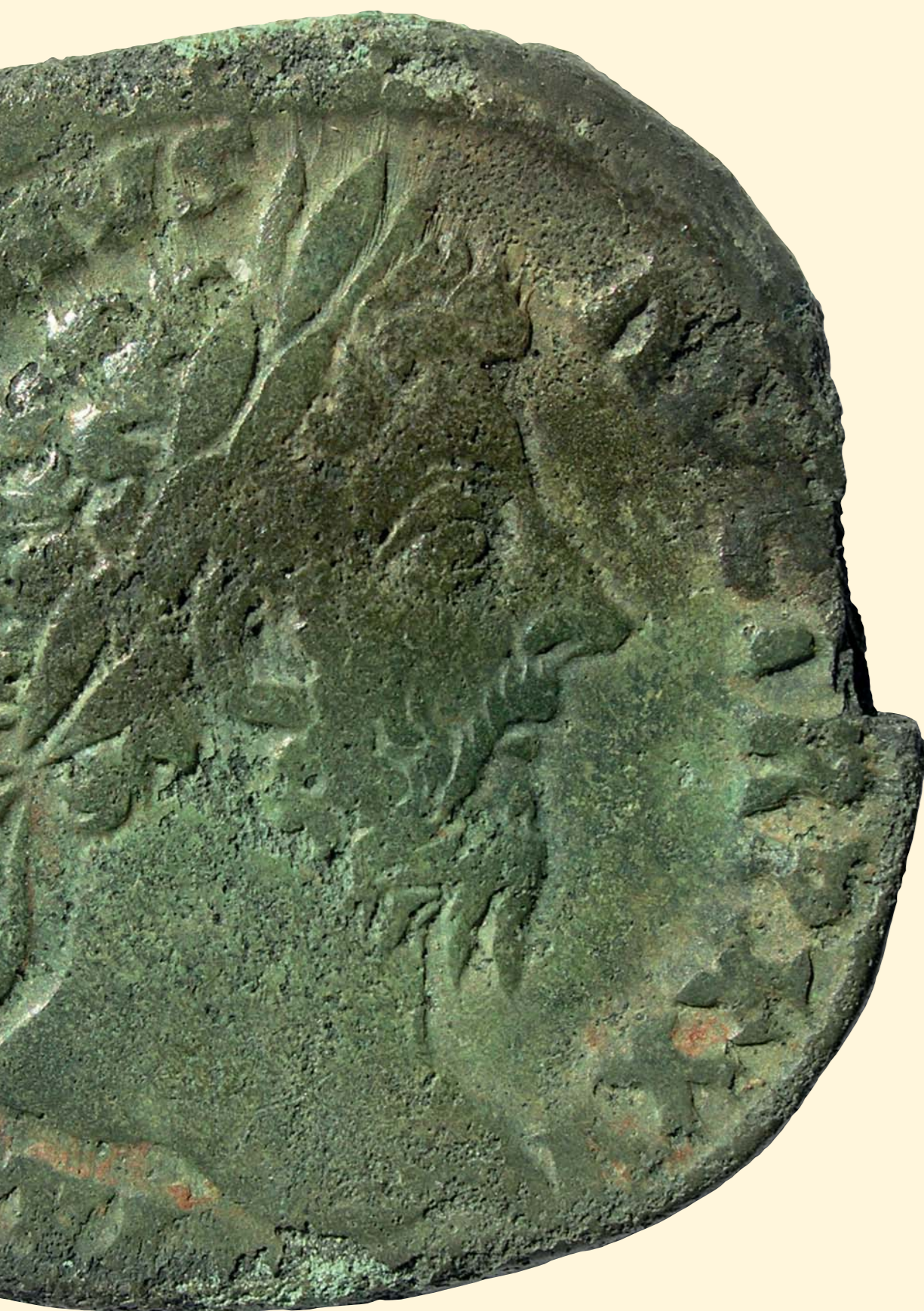
Sesterz des Marcus Aurelius, 171 n. Chr., gefunden 2007 bei einer Sondage in der Straßenstation von Schlingen. (Die Funde werden im Sebastian-Kneipp-Museum Bad Wörishofen ausgestellt)

In römischer Zeit besaß die Straße als Aufmarschrouten des Militärs, als Handelsweg und zentrale Ader des Reiseverkehrs höchste Bedeutung. Sie war Grundlage für das Funktionieren der römischen Zivil- und Militärverwaltung.